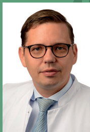
Prof. Dr. med. M. Canis Direktor der Klinik

Wir freuen uns auf einen lebhaften Informationsaustausch in entspannter Atmosphäre.